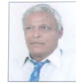
-नाति महर्जन थ:चपा, पाँगा

वा मचात छिमित थौं जिं ज्ञानी धायकेगु खँ छगु कने 'सुभाय' शब्द दुने दुगु छिमिसं मस्यगु मंत्र कने ज्ञानी धायकेगु शक्ति दु 'सुभाय' धा:गु स्वग: आख: दुने 'सुभाय' धैगु स्वग: आख: छिमिसं सय्के माल मा:माथाय् छेला केने